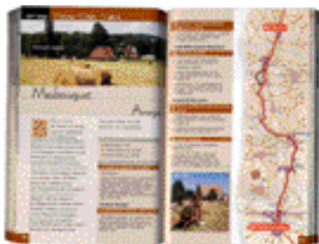
Guides pratiques du cheminant (Rando Editions / ACIR)

Pour obtenir des informations précises sur les chemins de Compostelle, vous pouvez vous procurer des guides pratiques, des topoguides, des cartes. Mais selon l'équipement de chaque itinéraire (balisage, hébergements spécifiques), les sources d'information ne sont pas nécessaires en même quantité. Par exemple, pour cheminer sur le Camino Francés, un guide pratique suffit ; d'autres chemins demanderont une carte en complément.