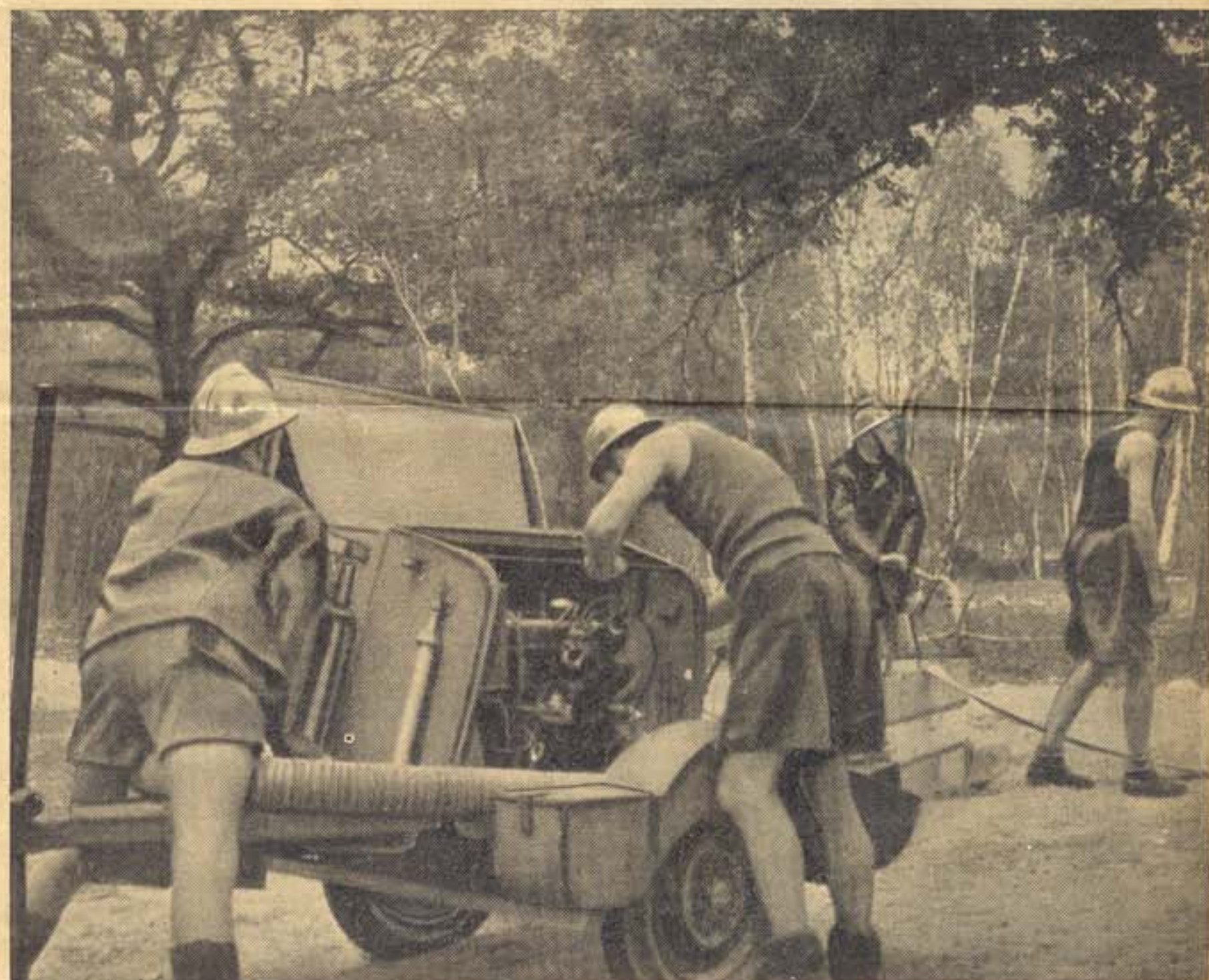
UNE EQUIPE DE SCOUTS-POMPIERS AU COURS D'UN EXERCICE D'ENTRAINEMENT