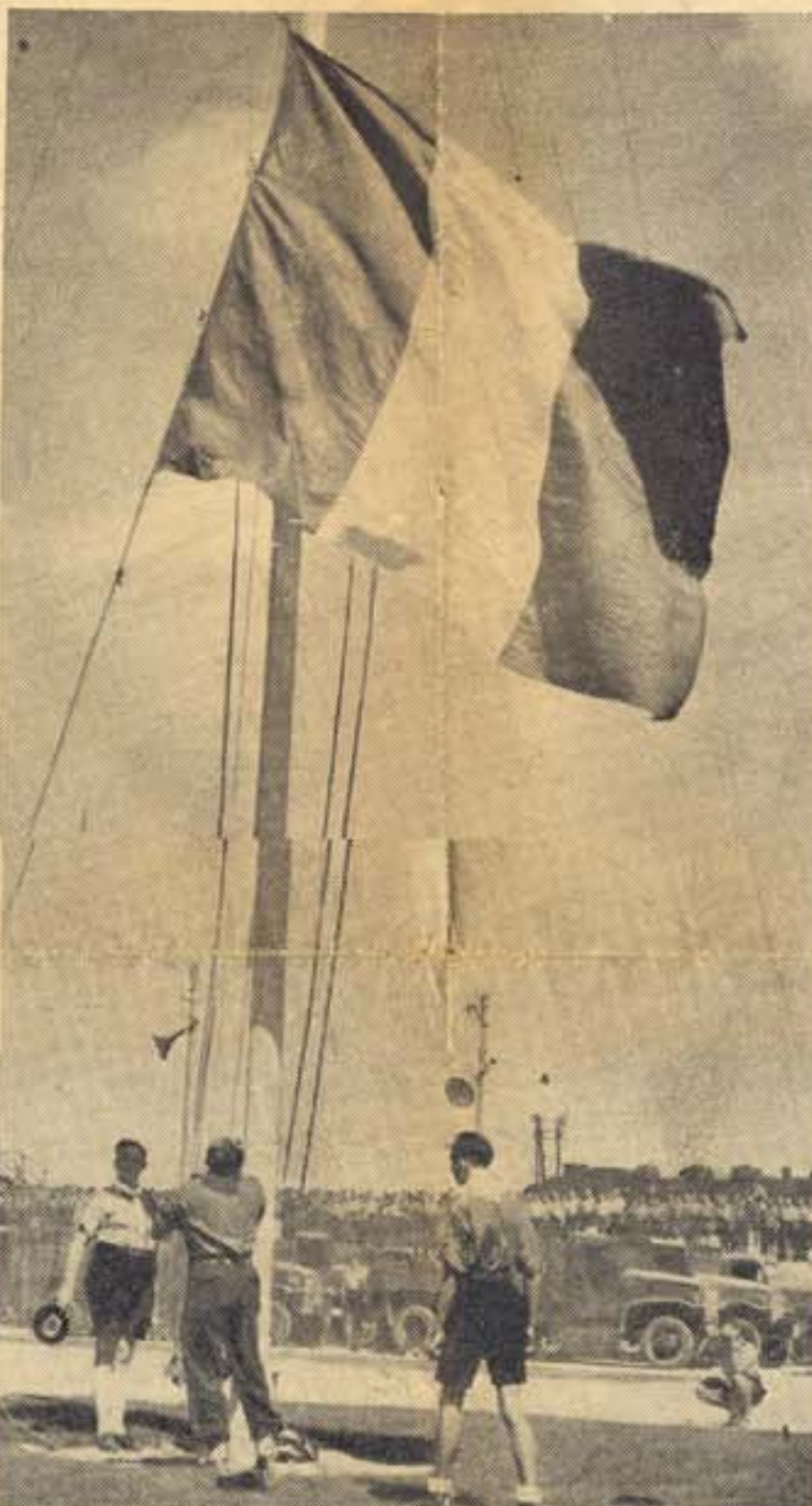
LE PREMIER ENVOI DES COULEURS