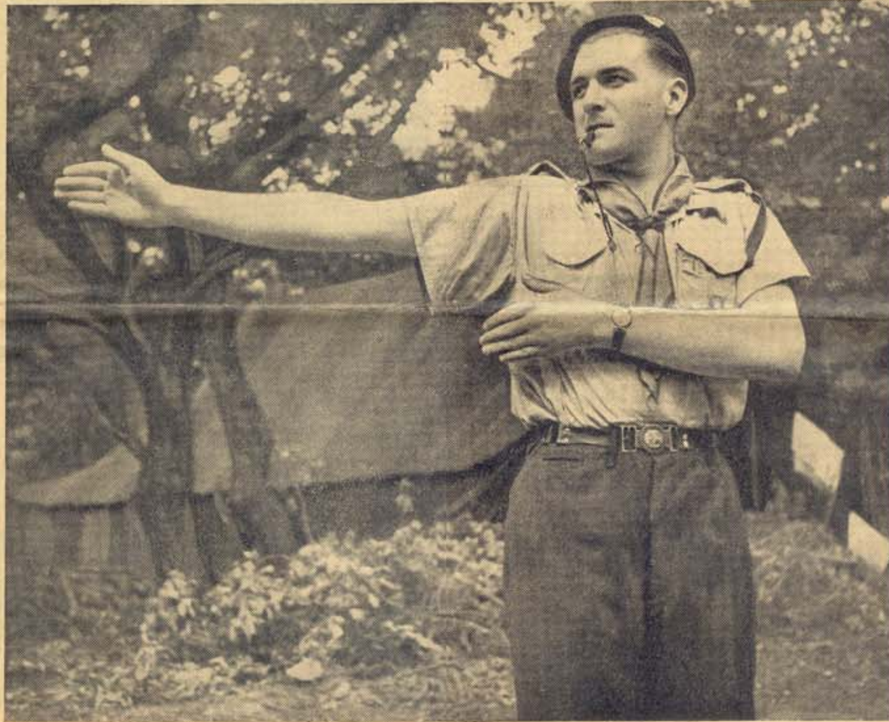
UN « POLICIER » SCOUT REGLANT LA CIRCULATION

Lisez LE FIGARO soit en l'achetant au numéro, soit en souscrivant un abonnement